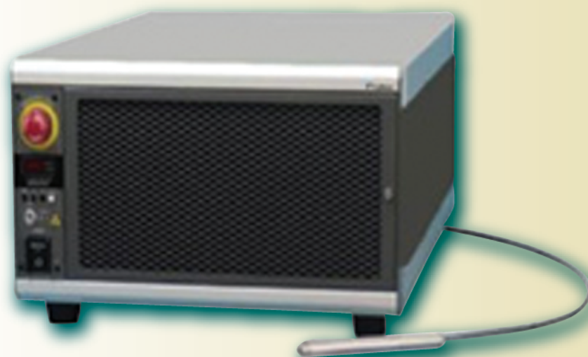
300W連続波空冷ファイバレーザー FLC-300-Aシリーズ