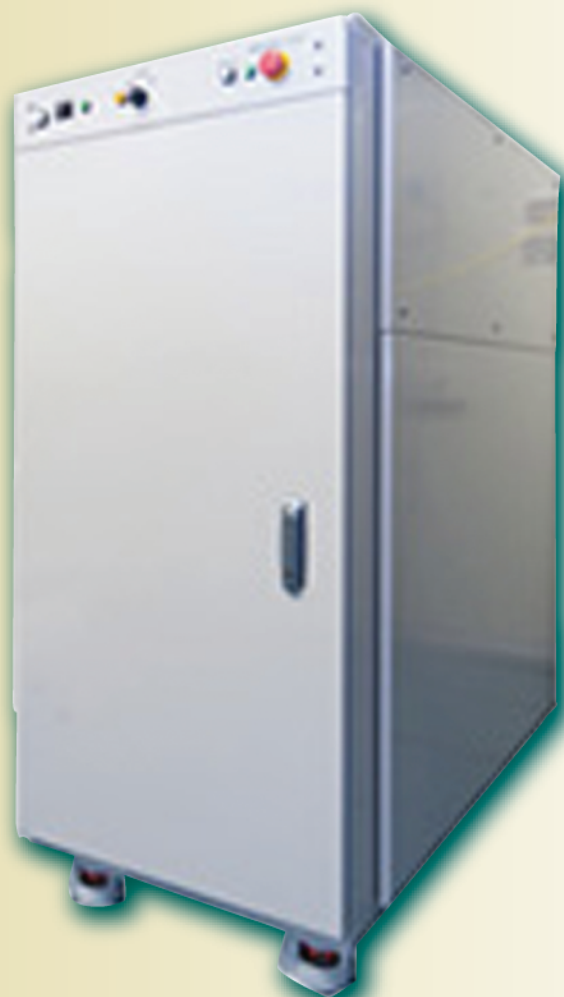
4kW連続波ファイバレーザー FLC-4000-Wシリーズ